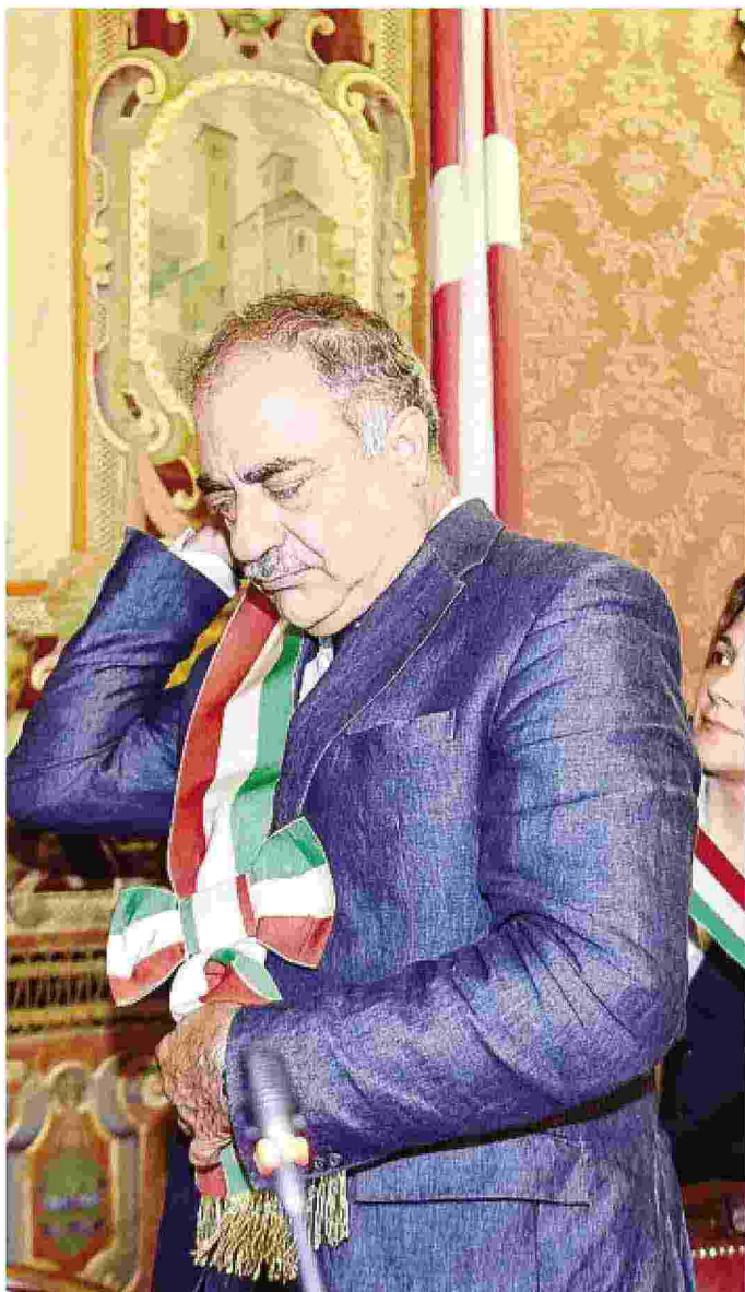
L'esordio con la fascia tricolore, lo scorso luglio