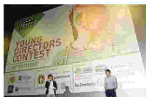
Oltre 100 i video in concorso

Successo della premiazione del concorso "Ciakkare" promosso da "La Provincia" all'Uci Cinemas di Montano: 103 i video degli studenti. SERVIZI A PAGINA 26