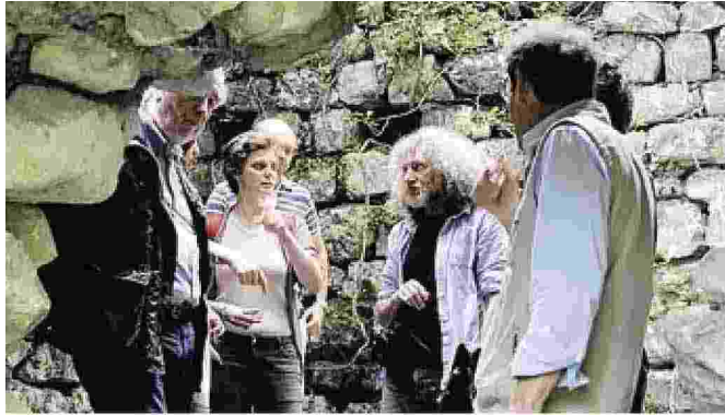
Il sopralluogo effettuato alcuni anni fa dagli esperti