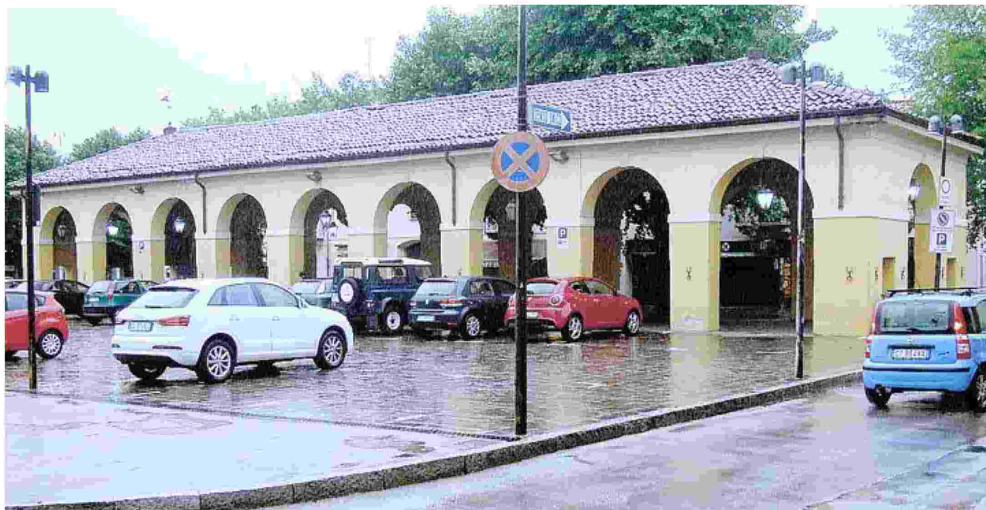
I portici di piazza del Mercato nel centro di Erba ospitano la sede della sagra del Masigott e sono uno dei simboli della città