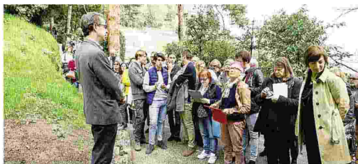
Da domenica il nuovo percorso sarà aperto al pubblico