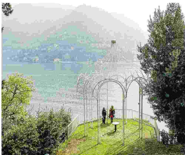
Uno dei meravigliosi scorci che si possono ammirare dal "Chilometro della conoscenza"