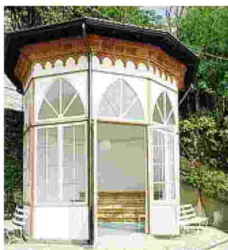
Un particolare del parco