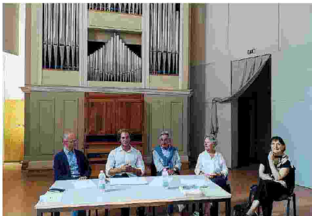
Un momento della presentazione del festival "Bellezze Interiori - I giardini segreti di Como"

I giardini hanno storie e patrimoni da raccontare e i proprietari sono stati felici di condividere