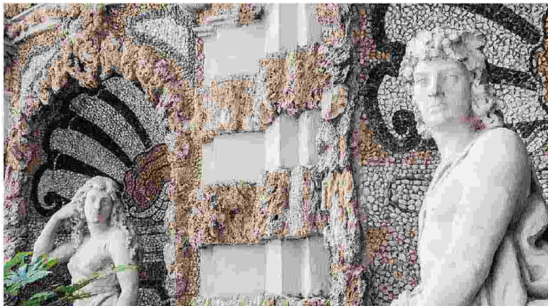
Un bucolico scorcio del giardino di Palazzo Arturo Stucchi, in via Giuseppe Rovelli 28 a Como, che aprirà le porte ai visitatori