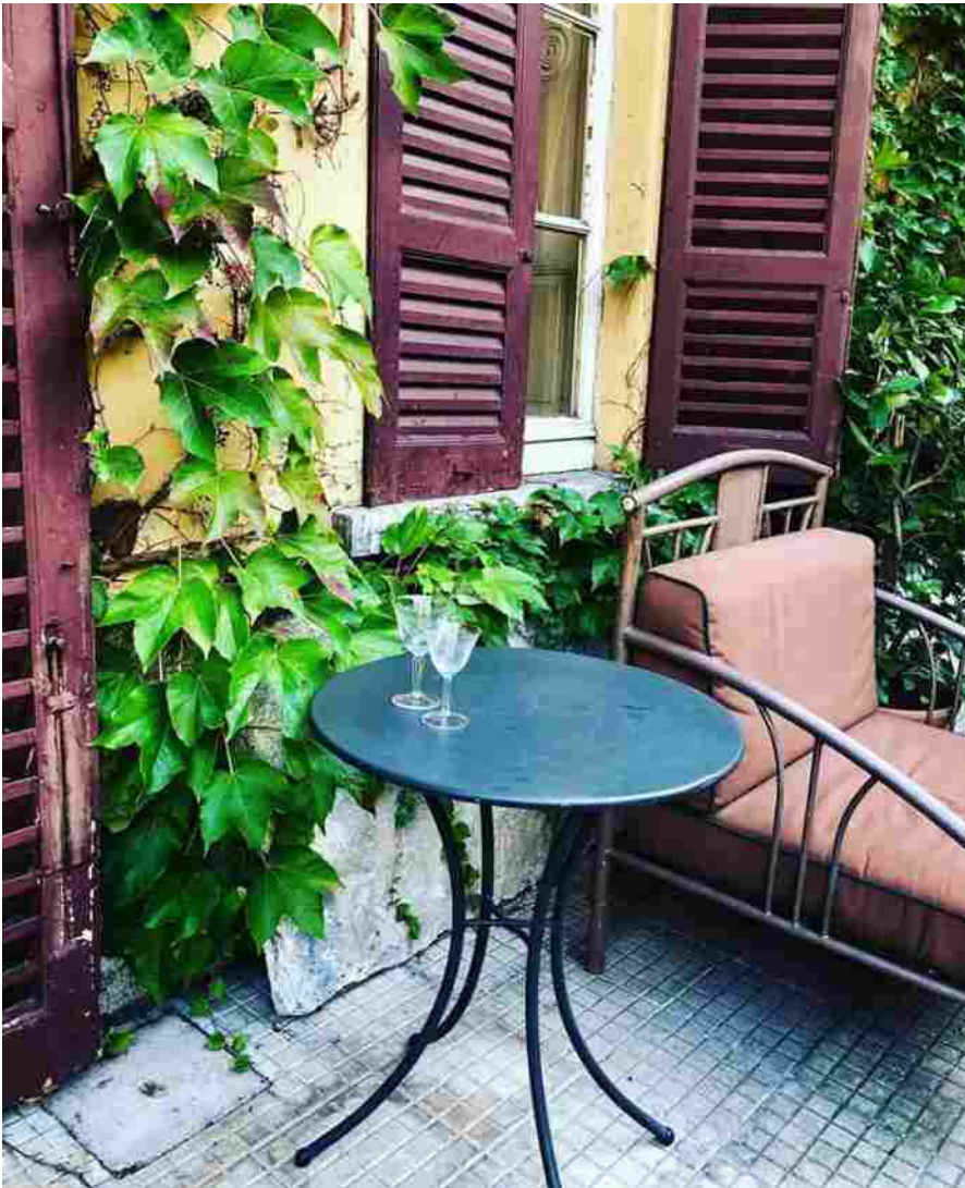
Palazzo Albricci Peregrini