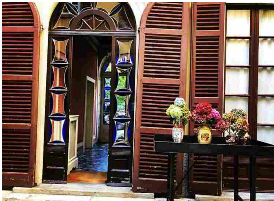
Palazzo Albricci Peregrini

Per l'occasione saranno aperti al pubblico: