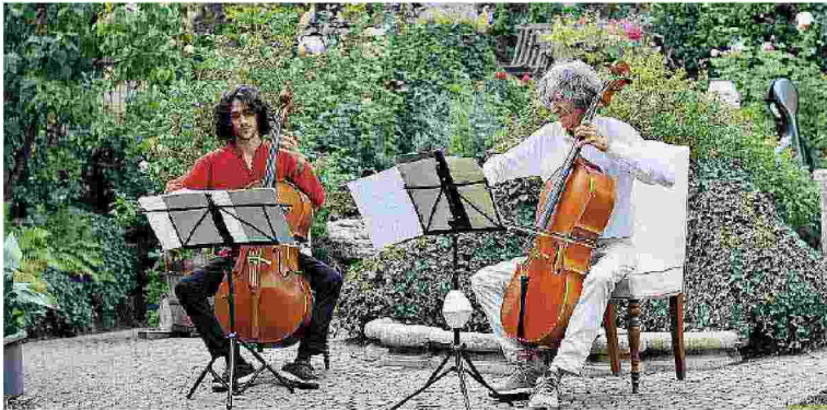
A Como Alcuni luoghi visitabili in città: sopra, da sinistra, Palazzo Lambertenghi e Palazzo Arturo Stucchi; al centro, concerto a Palazzo Albricci Peregrini; in basso, Torre Gattoni e il giardino pensile di via Lambertenghi 34