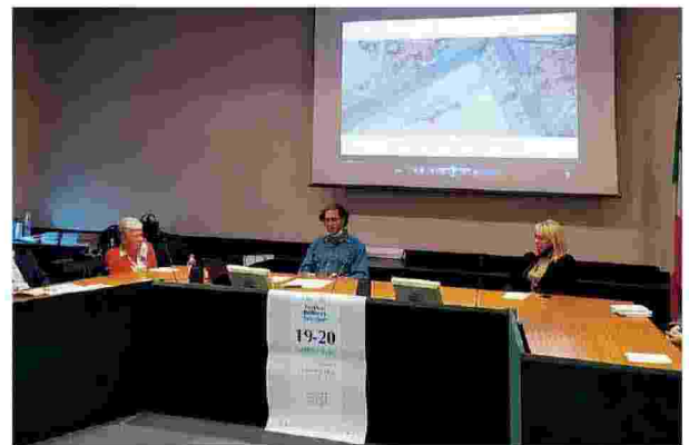
Da sinistra, interno di un giardino meta delle visite di “Bellezze interiori” e un momento della conferenza stampa di presentazione dell'edizione 2020 della manifestazione