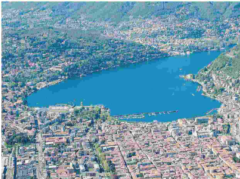
Le nuove povert  si sentono con sempre maggiori intensit  anche nella realt  comasca, solo in apparenza benestante